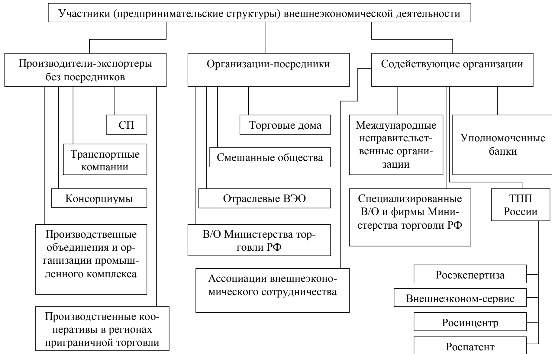
Рисунок 2 - Классификация субъектов внешнеэкономической деятельности в предпринимательской сфере международных рынков