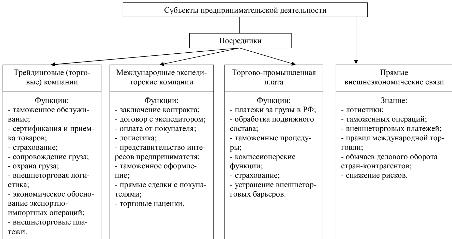
Рисунок 4 - Предлагаемая схема организации предпринимательской деятельности в сфере внешнеэкономических связей хозяйствующих субъектов