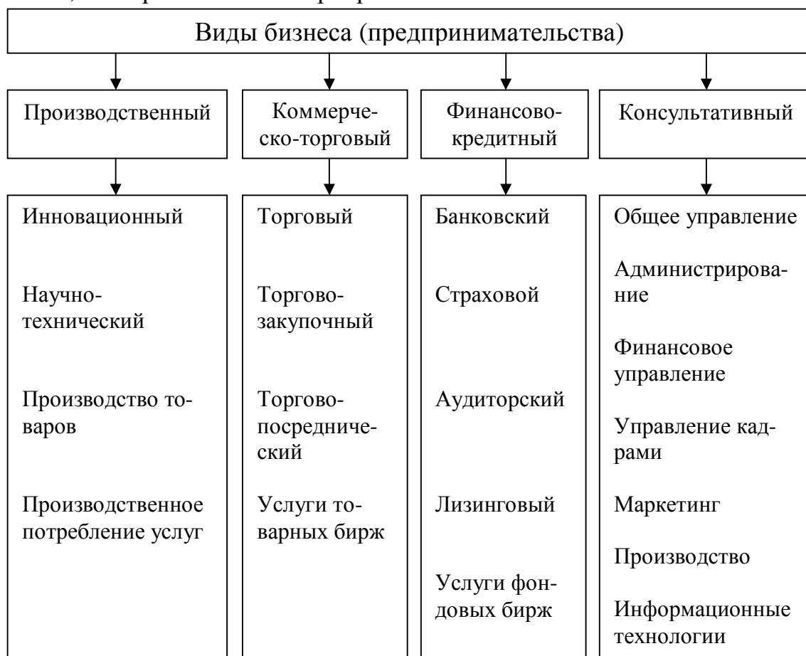
Рисунок 1 - Виды и подвиды бизнеса (предпринимательства) в рыночной экономике

внешнеэкономической деятельности и стимулировать экономический рост. Как показывает опыт многих стран с рыночной экономикой их достижения, в том числе темпы экономического роста, инвестиции, нововведения напрямую зависят от реализации предпринимательского потенциала. Можно утверждать, что предпринимательские способности как ресурс более эффективно реализуются в условиях максимально либеральной экономической системы, не обремененной бюрократией.